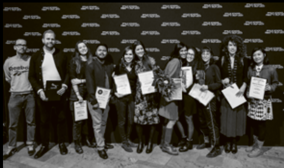
Die Preisträger des Filmschoolfest 2019.