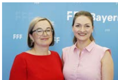
Digitalministerin und FFF-Aufsichtsratsvorsitzende Judith Gerlach:

Im Sommer und Herbst 2019 hat der FFF folgende Projekte im Förderprogramm Internationale Koproduktionen sowie Serien für den internationalen Markt im Bereich Stoffentwicklung unterstützt: