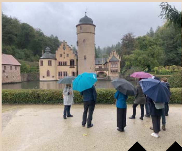
Die Stationen des Drehbuchcamps waren in Dachsbach, Volkach, Mespelbrunn, Lohr am Main, Veithöchtsheim, Würzburg, Frickenhausen und Rothenburg. Im Mittelpunkt standen die Menschen vor Ort und ihre Geschichten.