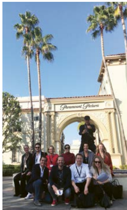
Auch ein Besuch bei Paramount stand auf dem Programm.

In den Meetings standen Studio Executives von Walt Disney, Paramount und Focus Features (NBC Universal) den Teilnehmern Rede und Antwort. Amazon Prime Video erläuterte die globale Strategie. Die Gründerin von 44 Blue, einer der größten Factual Produzenten der USA, führte durch die TV-Landschaft der Non Fiction-Welt. Die